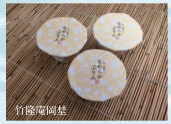
なめらかプリン 380円/1個