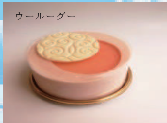
白桃フロマージュ 500円