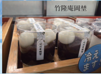
白玉ぜんざい 270円/1個