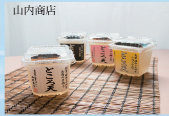
①ところ天 ②ところ天黒蜜 ③ところ天梅じそ ④ところ天中華 各150円