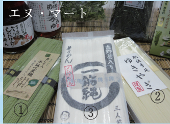
③ 一筋縄麦縄素麺 594円