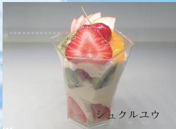
フルーツライフル 520円