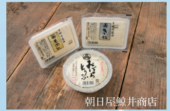
①おぼろ豆腐 220円 ②下町の逸品もめん 150円 ③下町の逸品きぬ 150円